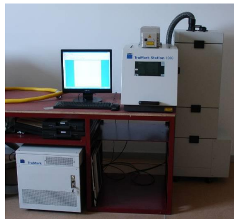
Fig. 1. Instalația de prelucrare cu laser.

Prelucrarea cu laser a probelor din aliaje FeCrAl s-a realizat cu ajutorul unui ECHIPAMENT DE GRAVARE CU LASER Nd: YAG - TruMark STATION 1000, TRUMPF din dotarea firmei Optoelectronica (fig. 1).