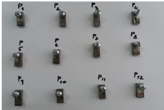
Fig. 3. Setul de probe analizate metalografic.

Probele au fost codificate și supuse prelucrării pe 2 suprafețe opuse (fig. 3) apoi s-au prelevat zone din porțiunea retopită cu laser pentru analiza metalografică. Parametrii regimului de prelucrare cu laser sunt prezentați în tabelul 2.